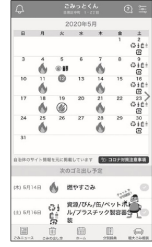
▲QRコードの取組が目で見られるアプリ画面

ことが可能。10日以内の対応し、カ国語に対応しているため、不動産会社やオーナーは外国人入居者に対する周知に利用することができる。 新型コロナウイルス感染症の患者も軽症であれば自宅待機をしている中、高い感染防止につなげた。普廃棄物として処理