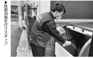
▲除菌消毒を行うスタッフ

ウチダレック 3000戸を管理するウチダレック鳥取東米子市は、2018年1月からアクセスモーションの「PMアシスト」を活用している。 これまでは、月2回の管理物件の清掃業務をパート社員7人で対応してきたが、業務内容の見直しを図る一環として外注した。 定期巡回や消火器具点検を実施したところ、消化器の交換サービス導入の効果を話す。